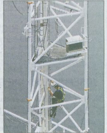
Arbeit in luftiger Höhe: ein SSC-Monteur „auf hoher See“.

verantwortlich. Gebaut werden Anlagen mit einer Leistung von 900 KW bis zu 6 Megawatt. „Derzeit unterstützen wir einen Kunden bei der Errichtung von 139 Anlagen der 2,5 MW-Klasse in einem Windpark an der Schwarzmeerküste in Rumänien“, berichtet Psarski. In der Firmengeschichte wurden mehr als 1000 Anlagen im On- als auch im Offshore errichtet. Auch am ersten deutschen Offshore-Windpark „alpha ventus“, 46 Kilometer vor der Nordseeinsel Borkum, ist die SSC Montage beteiligt. „Wir stellen zwei der derzeit vier Schichten mit jeweils 12 Mitarbeitern“, so Psarski. Auch in Italien, Frankreich, der Türkei oder vor der belgischen Küste ist das Unternehmen tätig. Eden: „2008 hatten wir mehr als 20 Baustellen.“